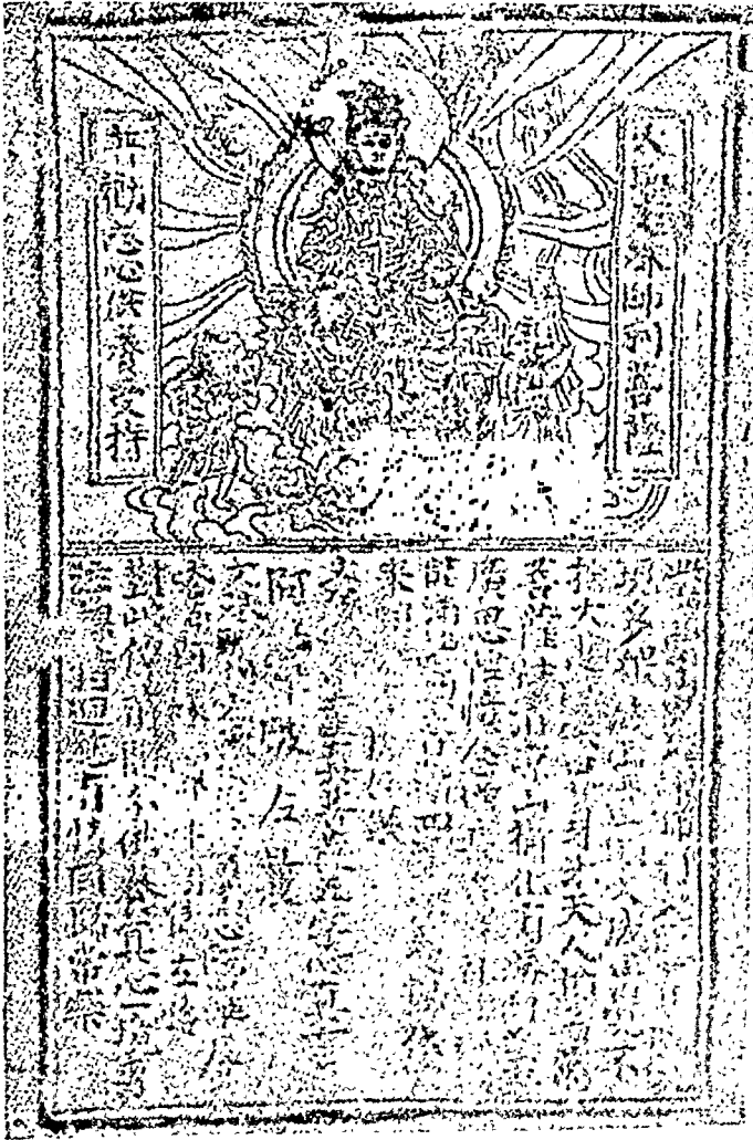
९ वीं शताब्दी के मध्य बोधिसत्व मञ्जुश्री के लकड़ी पर खोदे गये चित्र का एक प्राचीन चीनी मुद्रण।