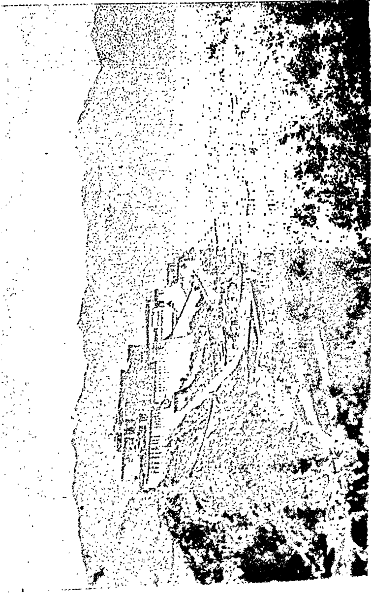
दर्याई लामा का पातल मठ, ल्हांग्सा ( तिब्बत )