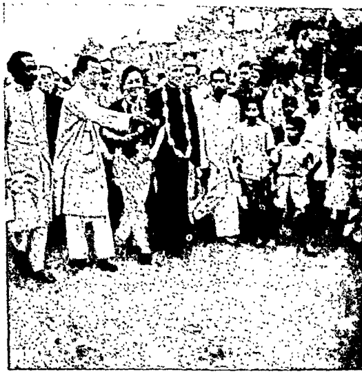
प्रे० चांग काई शेक, विश्वभारती—शान्ति-निकेतन में। १९३२ ई०