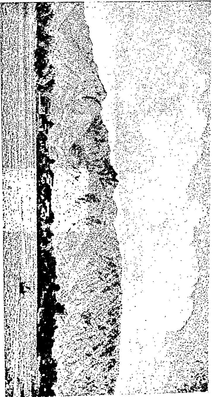
कांतुंग झील में लुशोन पर्वत का दृश्य, जहाँ धर्माचार्य हुई युआन ने चीन में बुद्धधर्म का पुंडरीक-साम्राज्य स्थापित किया था।