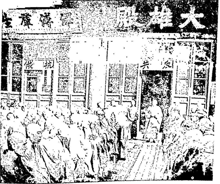
पीपिंग ( चीन ) के कुआंग-ची-मठ में चीनी बौद्ध साधु और उनकी प्रार्थना