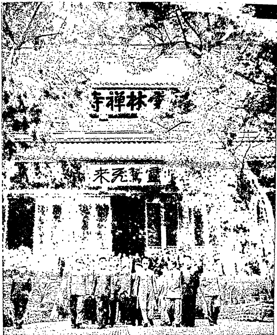
हांग चू के लिनयेन बीद्ध-मठ में प० जवाहरलाल नेहरू