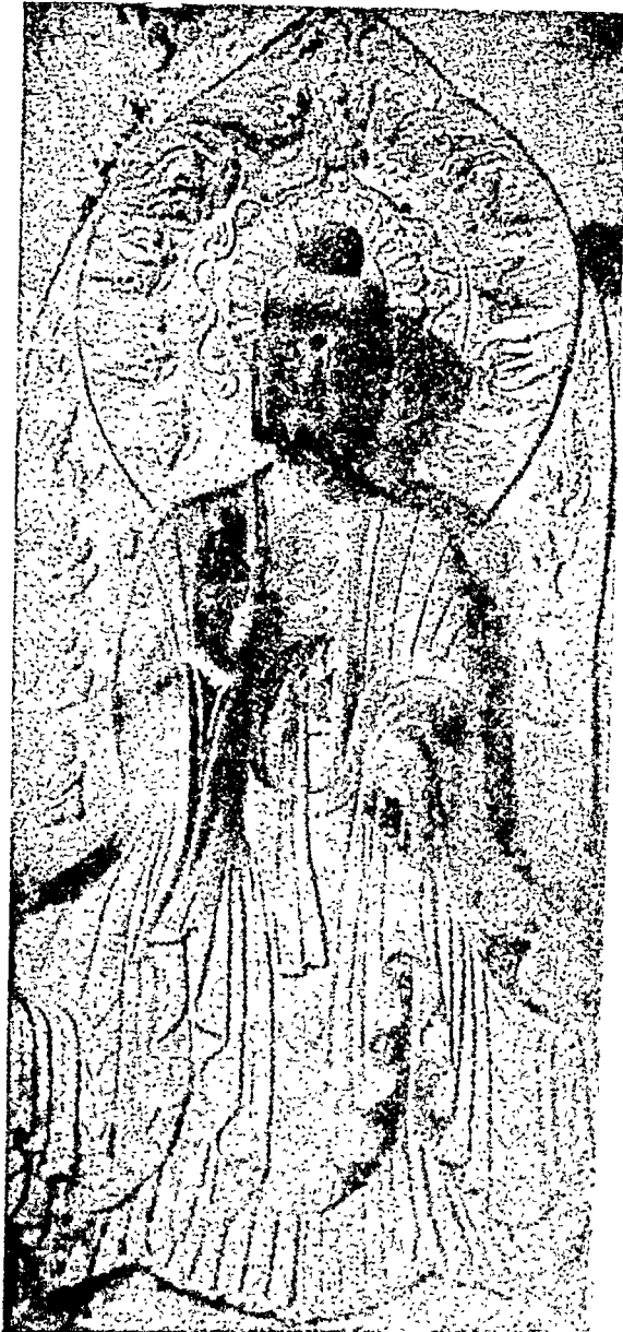
बुद्ध-विचार बाई-काल ( ३८६-५५६ ई० )