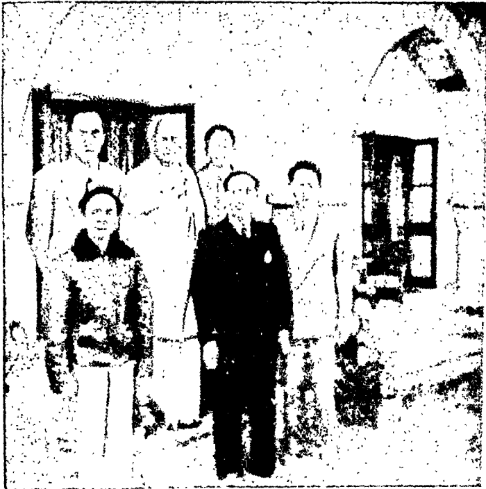
उपराष्ट्रपति डा० राधाकृष्णन् चीन की युद्धकालीन राजधानी चुंकिंग में। नन् १९४४ ई०