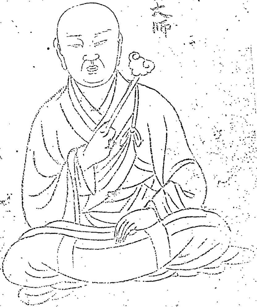
धर्मचार्य चिह-ई चीन में बूद्धधर्म के लिए-ताई सम्प्रदाय के संस्थापक