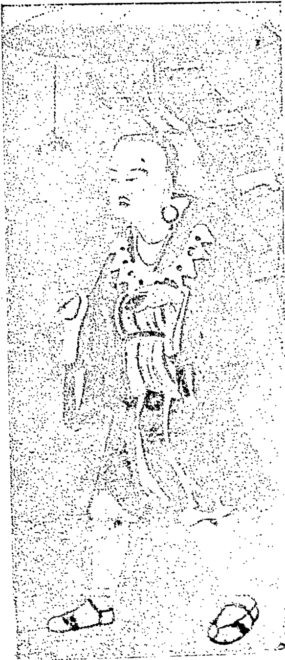
हुआन-त्सांग ( ५८६-६६८ ) महान् तांग-काल के दिपिटकालाग