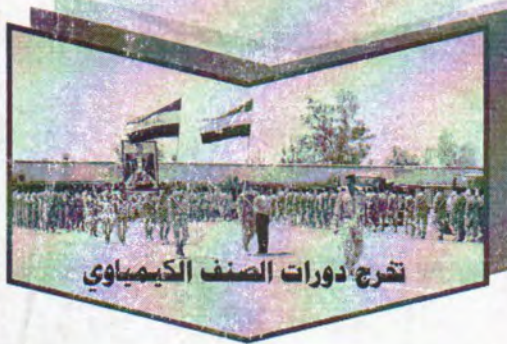
تخرج دورات الصنف الكيميائي