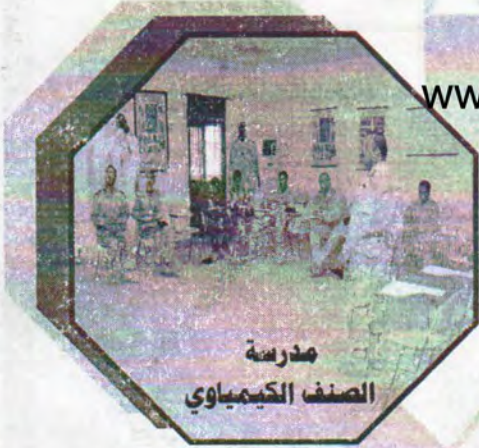
مدرسة الصنف الكيميائي