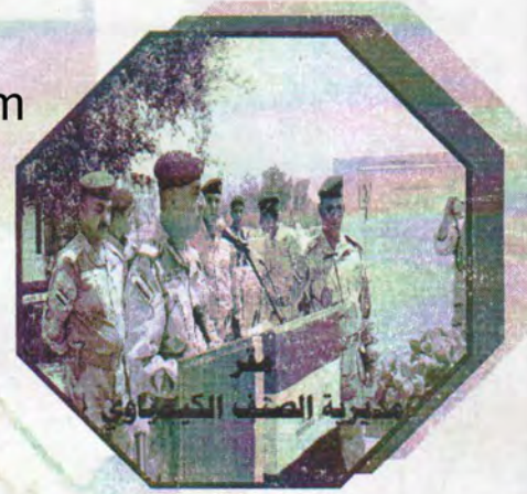
مديرية الصنف الكيميائي